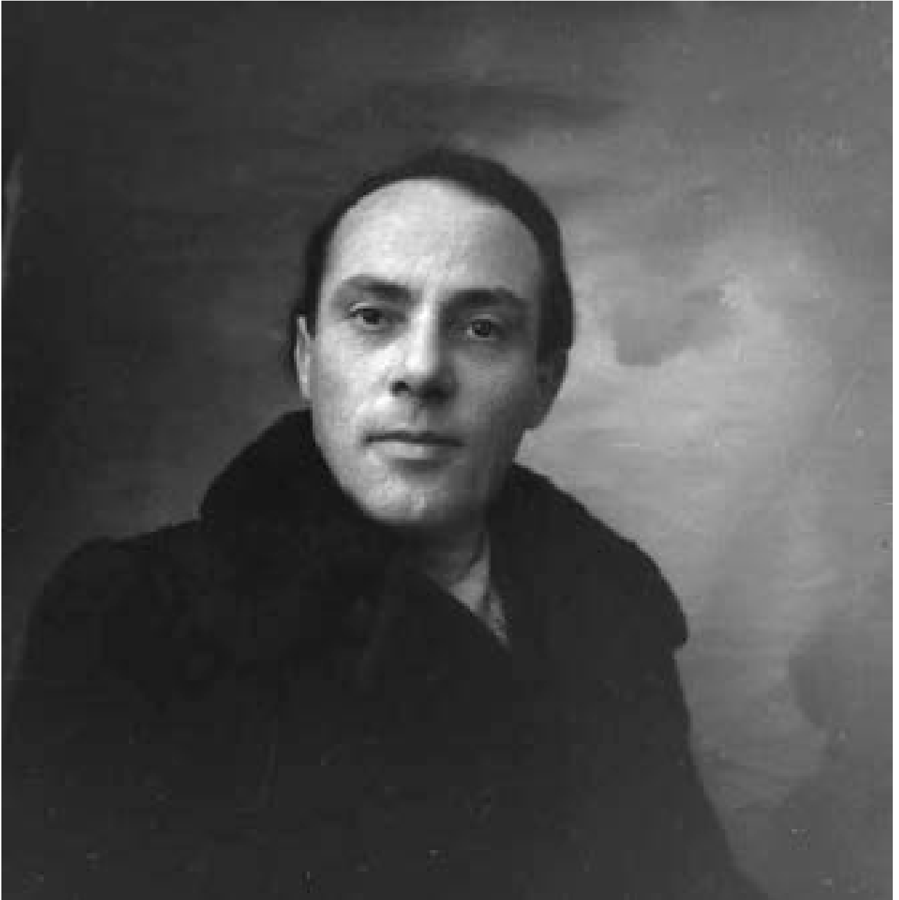
. F. 23